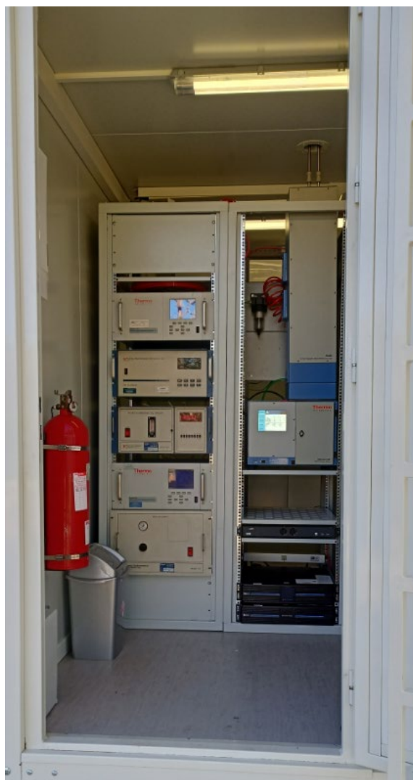
Detalle del rack de instrumentos en el interior de la cabina fija Hospital Joan March

El objetivo principal de TIRME S.A. es optimizar al máximo la contratación de estos servicios con el fin de obtener una disminución de los costes asociados, manteniendo en todo momento la calidad y la excelencia en la prestación del servicio.