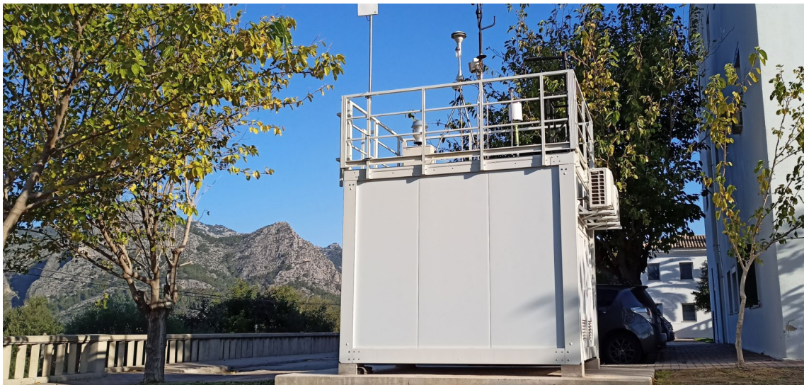
Vista general de la cabina fija en el Hospital Joan March

El presente pliego tiene por objeto definir las condiciones técnicas, económicas y administrativas que han de regir la prestación de los servicios para TIRME,S.A. referentes a la adquisición, instalación y puesta en marcha de dos analizadores para la cabina de control de calidad del aire ubicada en el Hospital Joan March.